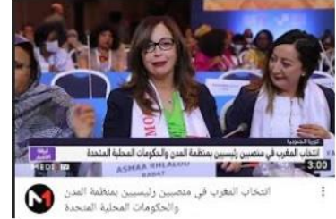
انتخاب المغرب في منصبين رئيسيين بمنظمة المدن والحكومات المحلية

https://medi1news.com/ar/article/262954.html