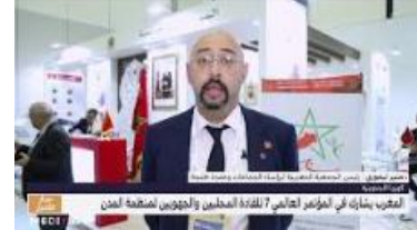
المغرب يتأخر في التواضع لعالمي 7 للقادة المحليين والجهويين لمنظمة المدن والحكومات المحلية

روبورتاج بخصوص مشاركة المغرب في المؤتمر العالمي السابع للقادة المحليين والجهويين لمنظمة المدن والحكومات المحلية